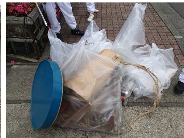
川沿いには、たばこの吸い殻やペットボトルが多く落ちていました。他にも雑誌や食べ物のゴミが捨てられていました。